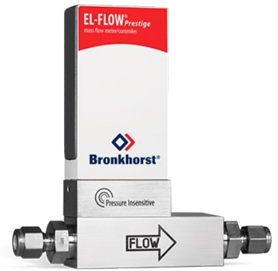
EL-FLOW PRESTIGE FG-111BP (P-INSENSITIVE)

Min. Bereich 0,14...7 mln/min Max. Bereich 0,4...20 ln/min Druckstufe 100 bar On-board Druckkorrektur 100 wählbare Gase