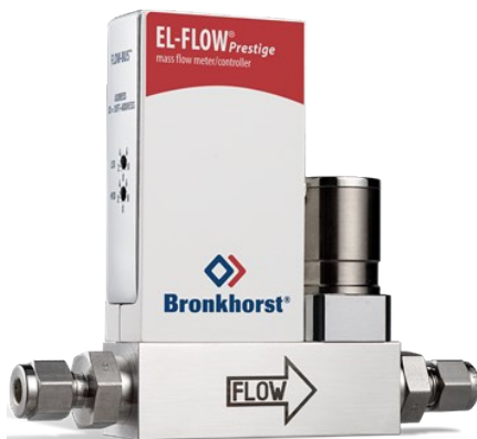
EL-FLOW PRESTIGE FG-210CV

Min. Bereich 0,14...7 mln/min Max. Bereich 0,4...20 ln/min Druckstufe 100 bar On-board Druckkorrektur 100 wählbare Gase