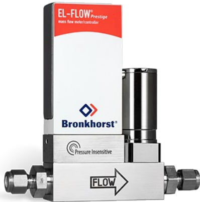
EL-FLOW PRESTIGE FG-200CVP (P-INSENSITIVE)

Min. Bereich 0,014...0,7 mln/min Max. Bereich 0,18...9 mln/min Druckstufe 10 bar On-board Druckkorrektur 100 wählbare Gase