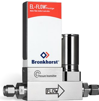
EL-FLOW PRESTIGE FG-211CVP (P-INSENSITIVE)

Min. Bereich 0,014...0,7 mln/min Max. Bereich 0,18...9 mln/min Druckstufe 10 bar On-board Druckkorrektur 100 wählbare Gase