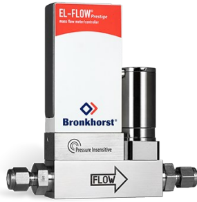
EL-FLOW PRESTIGE FG-211CVP (P-INSENSITIVE)

Min. Bereich 0,014...0,7 mln/min Max. Bereich 0,18...9 mln/min Druckstufe 10 bar On-board Druckkorrektur 100 wählbare Gase