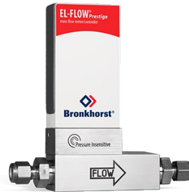
EL-FLOW PRESTIGE FG-111BP (P-INSENSITIVE)

Min. Bereich 0,14...7 mln/min Max. Bereich 0,4...20 ln/min Druckstufe 100 bar On-board Druckkorrektur 100 wählbare Gase