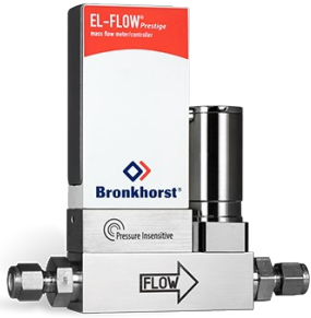
EL-FLOW PRESTIGE FG-200CVP (P-INSENSITIVE)

Min. Bereich 0,014...0,7 mln/min Max. Bereich 0,18...9 mln/min Druckstufe 10 bar On-board Druckkorrektur 100 wählbare Gase