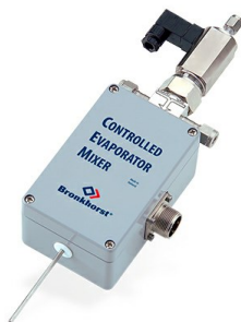
CEM EVAPORATOR W-102A

Max. 2 g/h Flüssigkeit; Max. 4 l/min Gas Druckstufe 100 bar Sehr stabiler Dampf- Durchfluss Flexibles Gas/Flüssigkeits Verhältnis