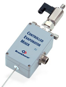
CEM EVAPORATOR W-101A

Max. 2 g/h Flüssigkeit; Max. 4 l/min Gas Druckstufe 100 bar Sehr stabiler Dampf- Durchfluss Flexibles Gas/Flüssigkeits Verhältnis