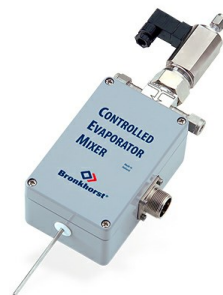
CEM EVAPORATOR W-202A

Max. 30 g/h Flüssigkeit; Max. 4 l/min Gas Druckstufe 100 bar Sehr stabiler Dampf- Durchfluss Flexibles Gas/Flüssigkeits Verhältnis