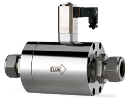
SERIE F-002A, F-003A, F-003B

Durchfluss bis ca. 50 l/min Druck bis zu 64/100/200 bar Kv-max: 6.6 \times 10^{-2}