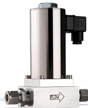
SERIES F-004A, F-004B

Durchfluss bis zu ca. 500 m 3 /h Druck bis zu 64/100 bar Kv: 0.04...6.0