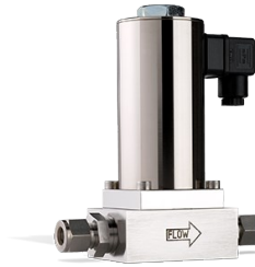
SERIES F-004A, F-004B

Durchfluss bis zu ca. 500 m 3 n/h Druck bis zu 64/100 bar Kv: 0.04...6.0