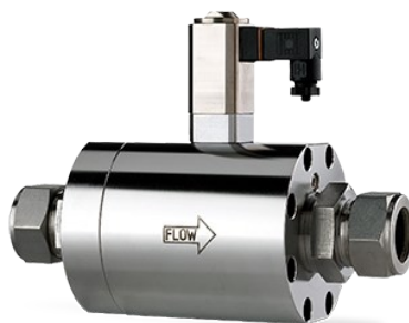
SERIE F-002A, F-003A, F-003B

Durchfluss bis ca. 50 l/min Druck bis zu 64/100/200 bar Kv-max: 6.6 \times 10^{-2}