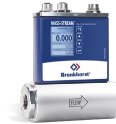
MASS-STREAM D-6370 & D-6470 MFM

Débit min. 17...500 ln/min Débit max. 167...5000 ln/min Pression jusqu'à 16 bar Boîtier robuste (IP54) Option afficheur TFT intégré