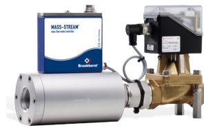
MASS-STREAM D-6383/BJ-1 & D-6483/BJ-1 MFC

Débit min. 40...2000 ln/min Débit max. 100...10000 ln/min Pression jusqu'à 20 bar Boîtier robuste (IP65) Option afficheur TFT intégré