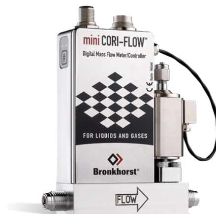
MINI CORI-FLOW™ M13V14I

Débit 0...200 g/h Pression 5 bar Indépendant des propriétés du fluide Grande précision