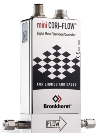
MINI CORI-FLOW™ M12

Débit 0...200 g/h Pression 200 bar Indépendant des propriétés du fluide Grande précision