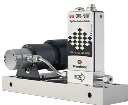
MINI CORI-FLOW™ CORIOLIS WITH PUMP

Débit 0...2000 g/h Pression 100 bar Indépendant des propriétés du fluide Grande précision