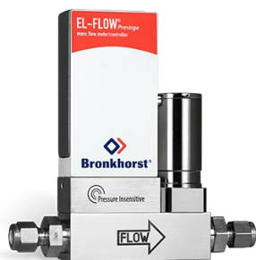
EL-FLOW PRESTIGE FG-200CVP (P-INSENSITIVE)

Débit min. 0,014...0,7 mln/min Débit max. 0,18...9 mln/min Pression 10 bar Correction de la pression intégrée 100 gaz embarqués