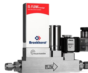
EL-FLOW PRESTIGE FG-201CSP (P-INSENSITIVE)

Débit min. 0,14...7 mln/min Débit max. 0,4...20 lln/min Pression 100 bar Correction de la pression intégrée 100 gaz embarqués