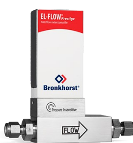
EL-FLOW PRESTIGE FG-111BP (P-INSENSITIVE)

Débit min. 0,14...7 mln/min Débit max. 0,4...20 lln/min Pression 100 bar Correction de la pression intégrée 100 gaz sélectionnables