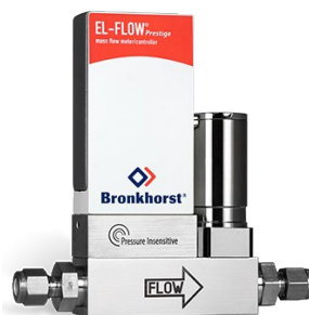
EL-FLOW PRESTIGE FG-201CVP (P-INSENSITIVE)

Débit min. 0,14...7 mln/min Débit max. 0,4...20 lln/min Pression 100 bar Correction de la pression intégrée 100 gaz embarqués