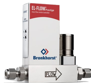
EL-FLOW PRESTIGE FG-211CV

Débit min. 0,14...7 mln/min Débit max. 0,4...20 lln/min Pression 10 bar Correction de la pression intégrée 100 gaz sélectionnables