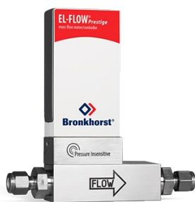
EL-FLOW PRESTIGE FG-111BP (P-INSENSITIVE)

Débit min. 0,014...0,7 mln/min Débit max. 0,18...9 mln/min Pression 100 bar Correction de la pression intégrée 100 gaz sélectionnables